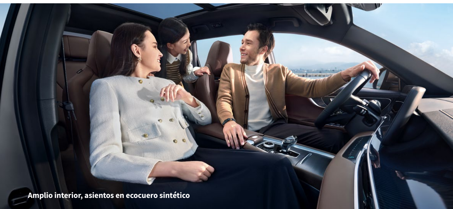
Amplio interior, asientos en ecocuero sintético