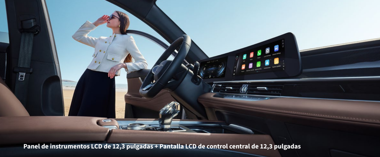
Panel de instrumentos LCD de 12,3 pulgadas + Pantalla LCD de control central de 12,3 pulgadas