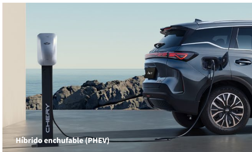
Híbrido enchufable (PHEV)